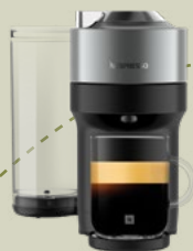
Vertuo Pop & Milk Vertuo Pop+