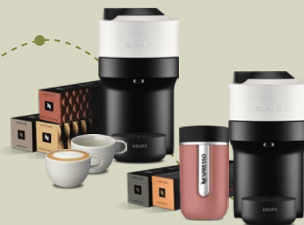
Pack Vertuo Pop